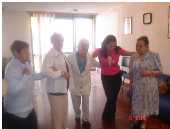
Centro de Entrenamiento, Orientación y Asistencia a las Demencias: Estimulación Rítmica y Cognitiva